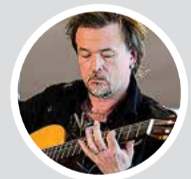
ZLATAN STIPIŠIĆ GIBONNI SKLADATELJ I IZVOĐAČ

„Svima je normalno da se ne krade povrće s placu ili artikli iz dućana, ali većina ih ipak uzima autorska djela bez razmišljanja. Važno je osvijestiti kako se tu radi o jednoj te istoj stvari.“