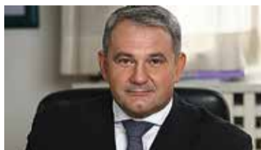
DAVOR MAJETIĆ GLAVNI DIREKTOR HRVATSKE UDRUGE POSLODAVACA – HUP

„Kreativne i kulturne industrije dobivaju sve veći značaj u globalnoj ekonomiji. Upravo u ovim industrijama prepoznaje se velik potencijal za gospodarski rast i kreiranje novih radnih mjesta. U Hrvatskoj područje kreativnih i kulturnih industrija, koje po nekim procjenama u ukupnom BDP-u sudjeluje s čak 4%, još uvijek nije dovoljno prepoznato i kvali-