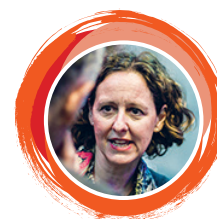
Hrvatska ministrica kulture dr. sc. Nina Obuljen Koržinek

„Sretni smo da je stav svih europskih institucija da se ovom Direktivom uistinu treba riješiti nepravda na Internetu i stvoriti za sve bolji i slobodan Internet. Istina je i da nas od konačnog teksta Direktive koja bi trebala omogućiti i veću raznolikost na Internetu a time i bogatiju digitalnu sutrašnjicu za sve, dijeli još jedna službena procedura i ponovno glasanje u Europskom parlamentu. No, optimističan sam i vjerujem da ćemo uspjeti u našoj borbi za kreativnu digitalnu budućnost.