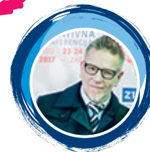
Predsjednik HDS-a Ante Pecotić

4 O prijedlogu Komisije očitovali su se, u službenoj proceduri , Vijeće ministara i Europski parlament te je u tijeku završni dio procedure koja bi trebala dovesti do ovog dugo očekivanog alata za uređenje jednog dijela digitalnog tržišta.