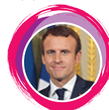
Predsjednik Republike Francuske Emmanuel Macron

Individualna prava i slobode svih koji dijele vlastite sadržaje ostaju ista kao do sada, ali je važno da platforme, koje u ovome trenutku isključivo generiraju dobit, osiguraju pravičnu naknadu onima čije sadržaje agregiraju. Ova je tema i na razini suradnje europskih ministara kulture prepoznata kao jedna od ključnih za očuvanje kulturne raznolikosti Europske unije i njezinih pojedinih država-članica“.